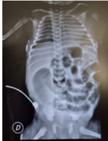
Fig.1: Asas dilatadas, ausencia de gas distal

Cumple plan de dilataciones completo. A los 6 meses del post operatorio presenta deposiciones diarias pastosas sin dificultad. Mantiene control en coloproctología actualmente, tiene pendiente corrección de hipospadias por parte del equipo de urología y descenso y pexia testicular bilateral. Se realizaron interconsultas pertinentes con endocrinología pediátrica y genetista por presentar asociación de hipospadias-criptorquidia.