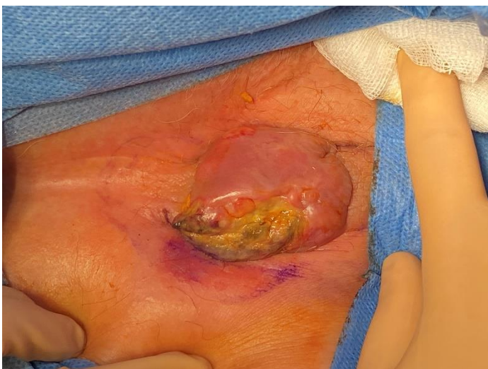
Fig. 1. Metástasis cutánea de carcinoma anal

Posteriormente recibió radioterapia en el lecho quirúrgico. Actualmente, 11 meses más tarde, se encuentra libre de enfermedad.