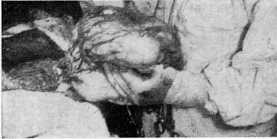
FIG. 2.—El grueso tumor está casi totalmente liberado. Falta ligar un pedículo vascular.