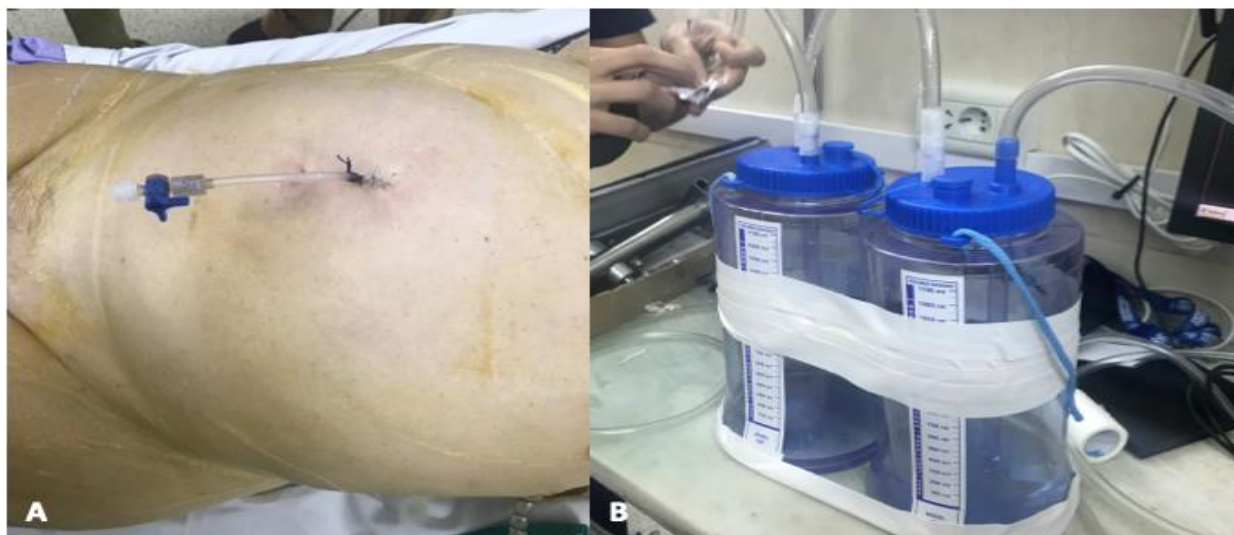
Fig. 4. A: se muestra catéter colocada a nivel supra-umbilical sobre línea media, y cerrado con una llave de 3 vías. B: dispositivo diseñado por los autores para la inyección de aire controlada.

Posteriormente, se pasó paciente a sala de quirófano. Se posicionó en decubito dorsal. Bajo sedación y anestesia raquídea, se realizó asepsia y antisepsia de tórax y abdomen. Se colocó campos quirúrgicos. Primero se abordó el abdomen: incisión supraumbilical en línea media de 1,5 cm, se diseco por planos e ingreso a cavidad abdominal. Se colocó sonda transparente esteril intrabdominal. Se fijó con vicryl y se cerro con una llave de tres vías (Figura 4A) Se instiló 1500 ml de aire en el inicio, y luego 500 ml por día a través de un dispositivo armado por los autores (Figura 4B).