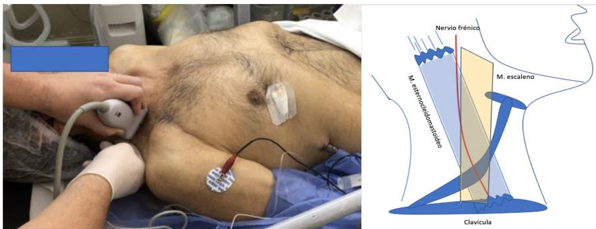
Fig. 3. Se observa el paciente posicionado con la cabeza hacia la izquierda; ecógrafo apoyado en el trayecto del nervio frénico, el cual se confirma a través de la neuroestimulación antes de la inyección anestésica. A la derecha, imagen esquemática realizada por el autor.

Cada paciente se posicionó en decubito dorsal, con la cabeza hacia el lado contralateral al hemitorax afectado. Se realizó asepsia y antisepsia de la region cervical. Se tomó como reparo la clavícula y el musculo esternocleidomastoideo. Se identificó con ultrasonido utilizando sonda lineal MHz el trayecto superficial del nervio, entre el musculo esternocleidomastoideo y el musculo escaleno anterior. Se confirmó con la aplicacion de neuroestimulacion, observando la contraccion diafragmatica. Se instiló 10 ml de bupivacaina al 0,25% (Figura 3).